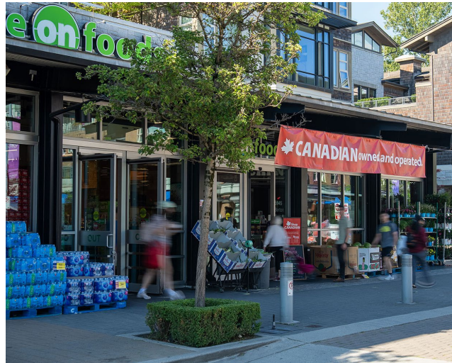
Save-On-Foods, BC Liquor Store, & More Bikes