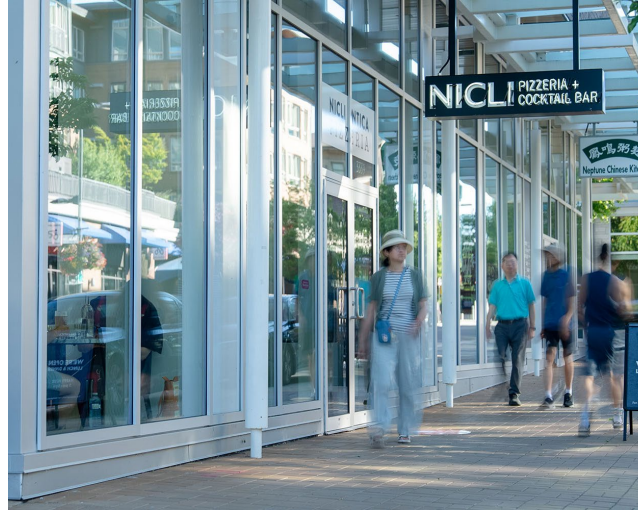
Nicli Pizzeria & Neptune Chinese Kitchen