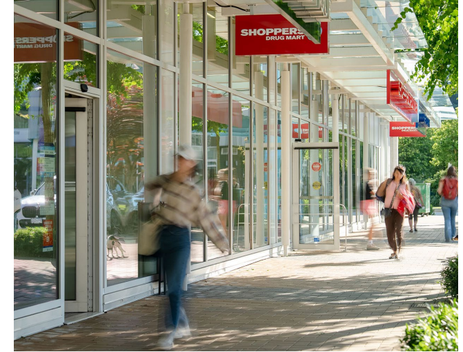
Shoppers Drug Mart