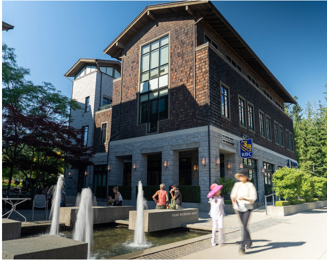
Wesbrook Village North Entrance