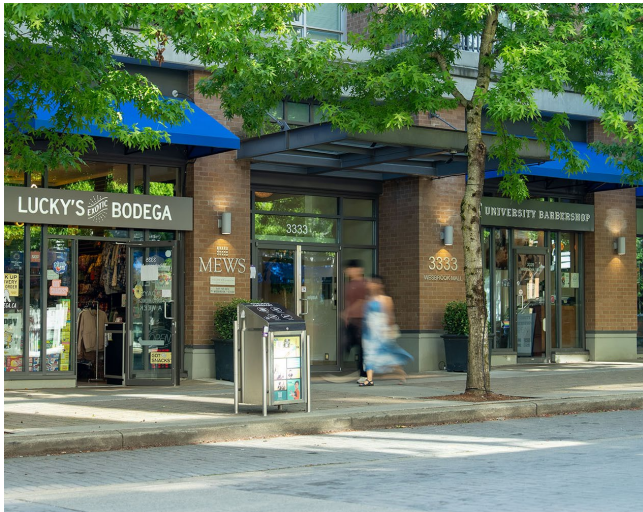
University Barbershop & Lucky's Bodega