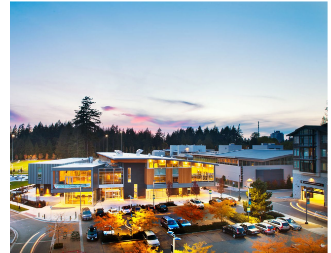
Wesbrook Village is home to the Wesbrook Community Centre and the University Hill Secondary School

For more information about the Wesbrook Community, visit www.discoverwesbrook.com